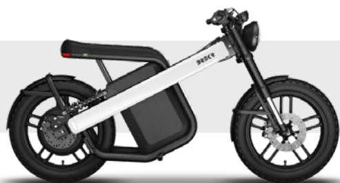
BREKR MODEL B